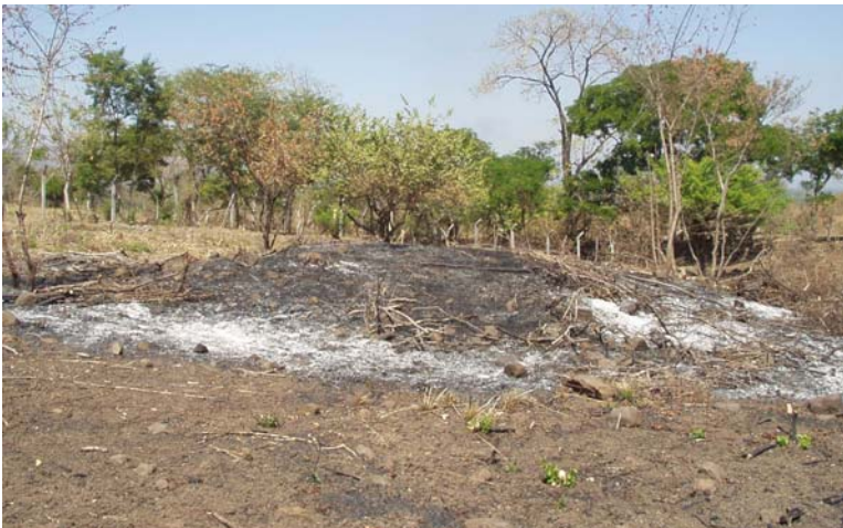
Figura 7: Estructura P-35, vista hacia el noroeste tomada en febrero de 2006.

La mayor estructura encontrada en el reconocimiento es una plataforma amonticulada designada como P-35. Se encuentra ligeramente hacia el suroeste de la quebrada intermitente. Tiene un diámetro de aproximadamente 10 metros, y una altura entre 0.5 y 0.75 metros. Su contorno actual de forma casi circular probablemente se debe a la erosión de una plataforma cuadrada. Por su tamaño y elevación, habría funcionado como una estructura cívica o religiosa, lo cual también se indica por la presencia en su superficie de un fragmento de incensario Las Lajas. Otros materiales visibles incluyen tiestos, obsidiana (navajas prismáticas y un fragmento de bifacio).