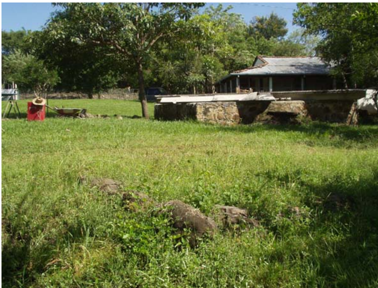
FIGURA 5: La Estructura P-32. Al fondo se observan el cimacio de piedra construida en los años setenta y la casa de Cihuatán.

Una plataforma delimitada por hileras de piedras pequeñas (de unos 20-30cm en diámetro). La porción visible tiene forma de “L”, ya que incluye una esquina.